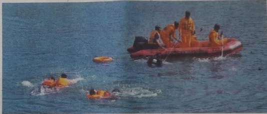
നിലേശ്വരം കോട്ടപ്പുറം അച്ചാമുരുത്തിയിൽ ദുരന്ത നിവാരണ വകുപ്പും എൻ ഡി ആർ എഫും സംയുക്തമായി നടത്തിയ മോക്ഡ്രിൽ.

ബോട്ടിലെ സഞ്ചാരികളായ എട്ട് പേരിൽ നാല് പേരെ ഫയർ ആൻഡ് റെസ്ക്യൂ ഫോഴ്സും ബാക്കി നാല് പേരെ എൻ ഡി ആർ എഫിനും രക്ഷപ്പെടുത്തി. രക്ഷപ്പെടുത്തിയവരും കരക്കെത്തിച്ച് മെഡിക്കൽ സംഘത്തിന്റെ നേതൃത്വത്തിൽ പ്രാഥമിക യാഥാതിര്യം നൽകി. തുടർന്ന് ഗുരുതരമായി പരിക്കേറ്റവരെ ആംബുലൻസിൽ നിശ്ചേഷ്ടം താലൂക്ക് ഹെൽ ക്യാർട്ടേജ് ആശുപത്രിയിലേക്ക് മാറ്റി. ഹൗസ് ബോട്ടിലുണ്ടായിരുന്ന അഞ്ച് ജീവന