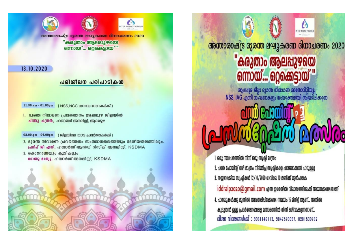
Figure 1-4 - Activities conducted as part of IDDRR 2019