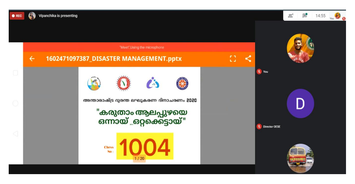
Figure 5 – power point presentation competition

The Power Point Presentation Competition conducted by the Alappuzha District Disaster Management Authority with the collaboration of National Service Scheme Alappuzha. The Programme was based on the topic of " Karutham Alappuzhayai, Onnay...Ottakettay ". We started the competition around 2pm on October 12<sup>th</sup>, with strict rules and regulations. There was strong participation from various colleges across the district and DDMA was also able to arrange a quality panel for the valuation process. After the completion of the competition, the judges had a confusion for the selection of the winners because of the quality of the slides and their presentation levels. The candidates had performed really well and the amount of research