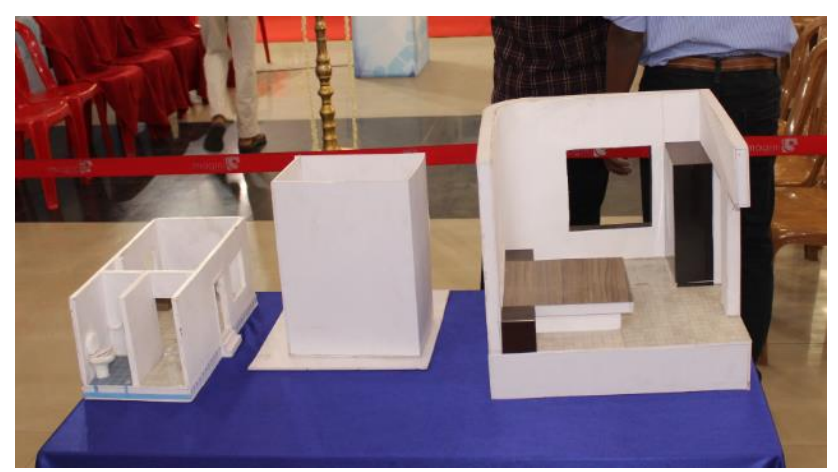
Model 3 – Left to right:

Part model: Model showing how water enters a building during floods