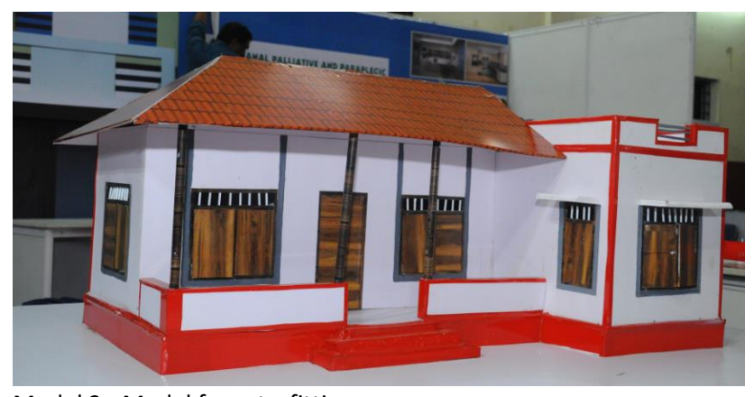
Model 2 - Model for retrofitting