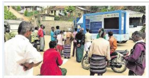
പ്രളയത്തെ അതിജീവിക്കുന്ന ഗൃഹനിർമാണ മാതൃകകളുമായി 'സുരക്ഷിതകേരളം' പ്രദർശനത്തിന്റെ ഭാഗമായി നടക്കുന്ന റോഡ് ഷോ

News published on 15<sup>th</sup> and 17<sup>th</sup> January