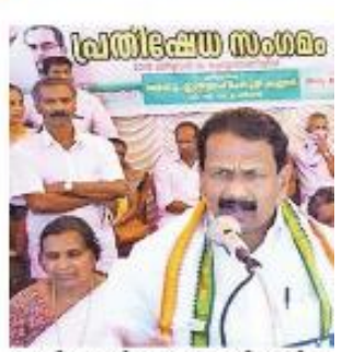
ദേശീയ കർഷക തൊഴിലാളി െ സംഗമം ഡിസിസി പ്രസിഡന്റ് ഇ

സംസ്ഥാന ദുരന്ത നിവാരണ അതോറിറ്റി, കുടുംബ,ശി, ഹാബി റ്റാറ്റ്, ശൂചിത്വമിഷൻ, എഫ്ആർ ബിഎൽ എന്നിവയുടെ പ്രദർശ ന സ്റ്റാളുകളും യുഎൻഡിപിയുടെ വിവിധ തരത്തിലുള്ള കെട്ടിട നിർമാണ മാത്യകകളും പ്രദർശനത്തിൽ ഉൾപ്പെടുത്തിയിട്ടുണ്ട്.