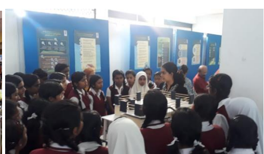
Inauguration at Alappuzha by District collector