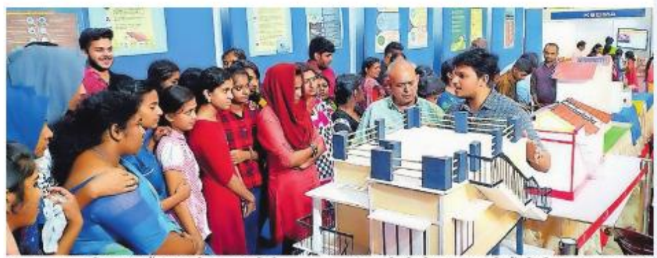
ആലുവ യുസി കോളജ് എംസിഎ ഹാളിൽ പ്രളയത്തെ അതിജീവിക്കുന്ന പരിസ്ഥിതി സൗഹൃദ ഗൂഹ നിർമാണ മാതൃകകളുടെ പ്രദർശനം കാണുന്നവർ.