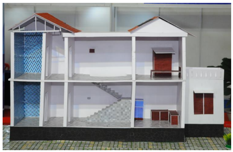
Model 4 - Sectional model of a multi-hazard resilient house