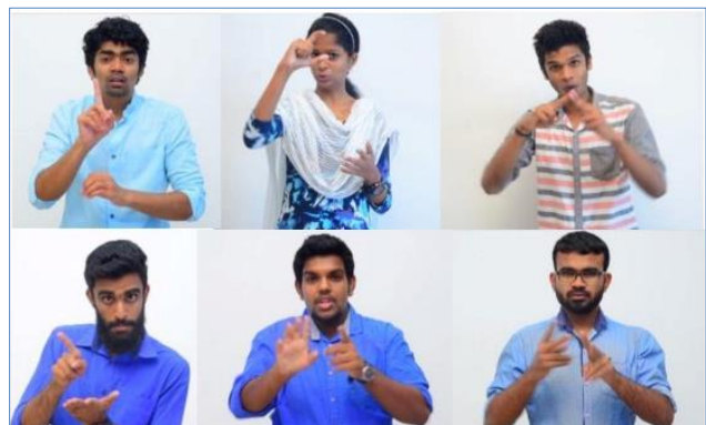
ആംഗ്യ ഭാഷയിലുള്ള നിർദ്ദേശങ്ങൾ

ജില്ലാ ദുരന്ത നിവാരണ അതോറിറ്റിയുടെയും ജില്ലാ സാമൂഹ്യ നീതി വകുപ്പിന്റെയും സഹകരണത്തോടെ ആണ് ജില്ലാതല പരിശീലന പരിപാടി സംഘടിപ്പിച്ചത്.