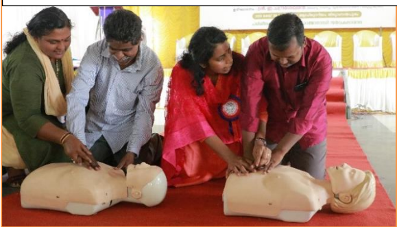
കാഴ്ച വൈകല്യം നേരിടുന്നവർ പ്രഥമ ശുശ്രൂഷയിൽ പരിശീലനം നേടുന്നു

ദുരന്ത നിവാരണത്തിൽ ഭിന്നശേഷിക്കാരെ പരിശീലിപ്പിക്കുന്നതിനു മുന്നോടി ആയി പരിശീലകർക്കുവേണ്ടിയുള്ള ആദ്യ ഘട്ട പരിശീലനം 2016 ഡിസംബർ 7 മുതൽ 9 വരെ