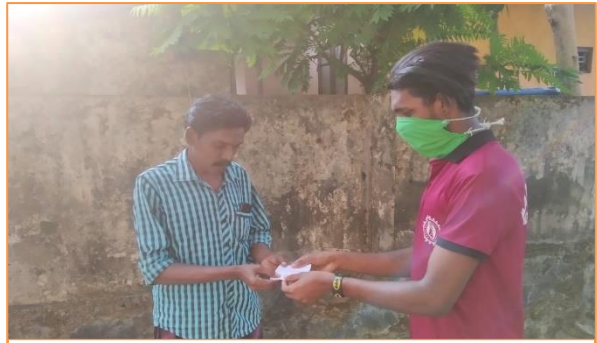
ശ്രവണ സഹായിക്ക് വേണ്ട ബാറ്ററി എത്തിച്ചു കൊടുക്കുന്ന ആപദ മിത്ര പ്രവർത്തകൻ

ഉപയോഗിക്കുന്നവർക്കായി സംസ്ഥാന ദുരന്ത നിവാരണ അതോറിറ്റിയുടെ നേതൃത്വത്തിലും നിഷിൻറെ സഹകരണത്തിലും ശ്രവണ സഹായി ഉപയോഗിക്കുന്നവരുടെ ബാറ്ററി മാറ്റുന്നതിനും പുനസ്ഥാപിക്കുന്നതിനും ശ്രവണ സഹായിക്ക് വരുന്ന തകരാറുകൾ ശെരിയാക്കുന്നതിനുമുള്ള സൗകര്യം ഒരുക്കി.