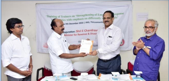
ബഹു. റവന്യൂ - ദുരന്ത നിവാരണ മന്ത്രി കൈപ്പുസ്തകം പ്രകാശനം ചെയ്യുന്നു

ജൂൺ 30-ന് ഈ മേഖലയിൽ പ്രവർത്തിക്കുന്ന വിദഗ്ദ്ധരുടെ ശില്പശാലയും സംഘടിപ്പിച്ചു. വിവിധ ഭിന്നശേഷിക്കാരോടു കൂടിയാലോചിക്കുകയും ചെയ്തതിനു ശേഷം അതോറിറ്റി പരിശീലകർക്കായുള്ള കൈപ്പുസ്തകം തയ്യാറാക്കുകയുണ്ടായി. ഈ