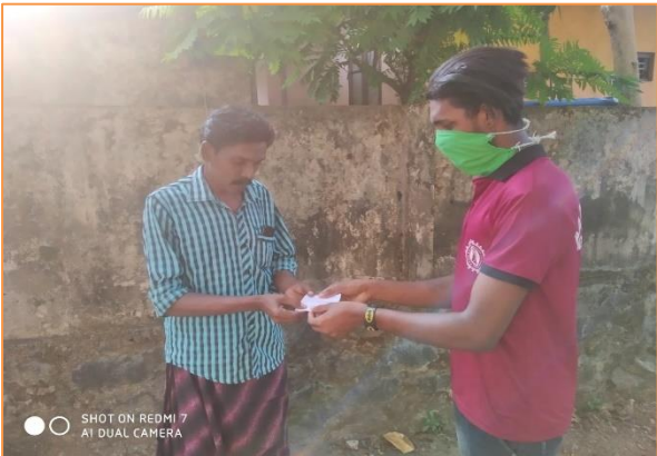
ശ്രവണ സഹായിക്ക് വേണ്ട ബാറ്ററി എത്തിച്ചു കൊടുക്കുന്ന ആപദ മിത്ര പ്രവർത്തകൻ

മറ്റേതൊരു ദുരന്തത്തിൽ എന്നപോലെ കോവിഡ് സമയത്തും ഭിന്നശേഷിക്കാരെ വളരെ പ്രതികൂലമായി ബാധിച്ചു. സംസ്ഥാന ദുരന്ത നിവാരണ അതോറിറ്റി നാഷണൽ ഇൻസ്റ്റിറ്റ്യൂട്ട് ഓഫ് സ്പീച്ച് ആൻഡ് ഹിയറിങ്ങ് എന്ന സ്ഥാപനവുമായി ചേർന്ന് ഭിന്നശേഷിക്കാർക്കായി 24 മണിക്കൂർ പ്രവർത്തിക്കുന്ന ഓൺലൈൻ ഹെൽപ്പ് ലൈൻ സംവിധാനം ആരംഭിച്ചു. ഇതിൽ ഏകദേശം 400 കോളുകൾ വന്നിരുന്നു. ഈ സംവിധാനത്തിൽ