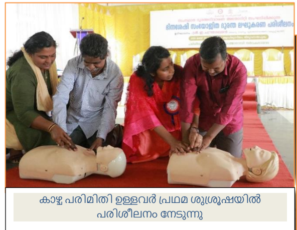
കാഴ്ച പരിമിതി ഉള്ളവർ പ്രഥമ ശുശ്രൂഷയിൽ പരിശീലനം നേടുന്നു

ദുരന്ത നിവാരണത്തിൽ ഭിന്നശേഷിക്കാരെ പരിശീലിപ്പിക്കുന്നതിനു മുന്നോടി ആയി പരിശീലകർക്കുവേണ്ടിയുള്ള ആദ്യ ഘട്ട പരിശീലനം 2016 ഡിസംബർ 7 മുതൽ 9 വരെ നടത്തുകയുണ്ടായി. 14 ജില്ലാ ദുരന്ത നിവാരണ അതോറിറ്റിയെപ്രതിനിധീകരിച്ചു ഉദ്യോഗസ്ഥരും 15 സർക്കാർരിതര സ്ഥാപനങ്ങളിൽ നിന്നുമായി 42 പേർ ആണ് ഈ പരിശീലനത്തിൽ പങ്കെടുത്തത്. ഇതേതുടർന്ന് എം.ജി യൂണിവേഴ്സിറ്റിയുടെ കീഴിൽ പ്രവർത്തിക്കുന്ന